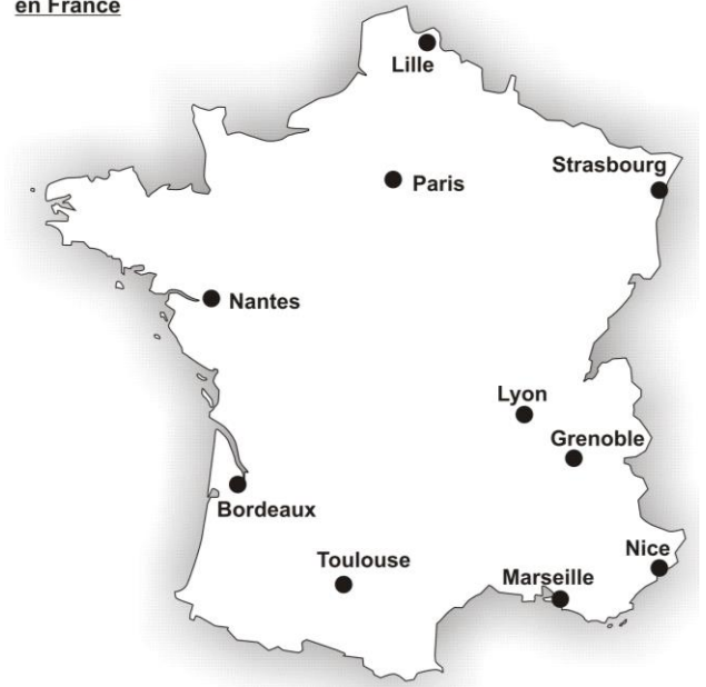
Les principales aires urbaines en France

Métropole : ville importante qui concentre des activités économiques, politiques et culturelles de niveau supérieur